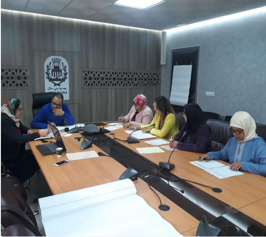
أشغال اليوم التأطيري لفائدة موظفي مكتب الإستقبال

المرحلة الخامسة : تنظيم اليوم التأطيري لفائدة الأطر المكلفة بمكتب الإستقبال 12 نونبر 2019