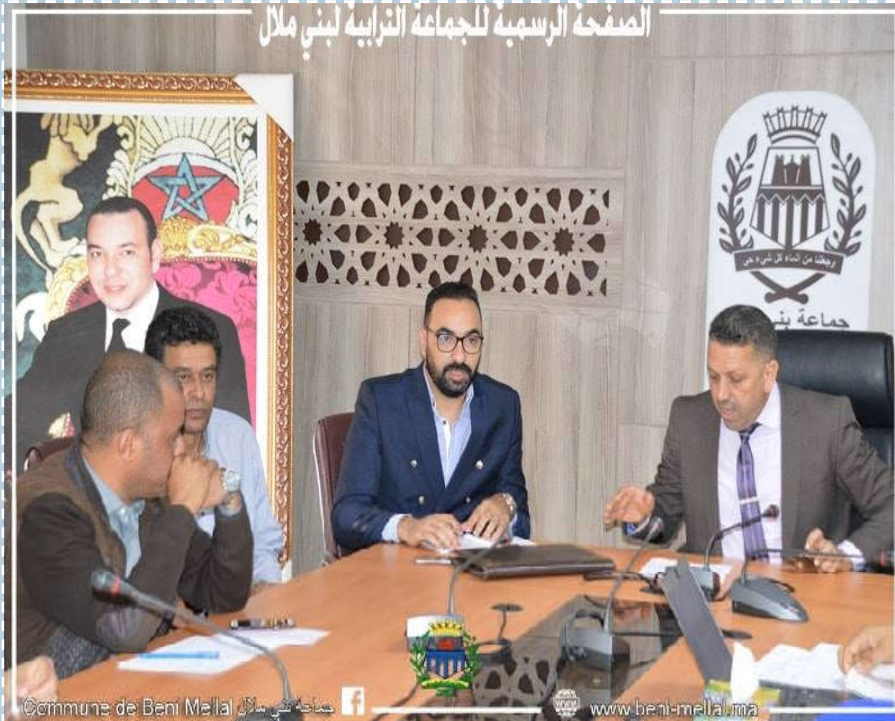
الصفحة الرسمية للجماعة الترابية لبني ملال