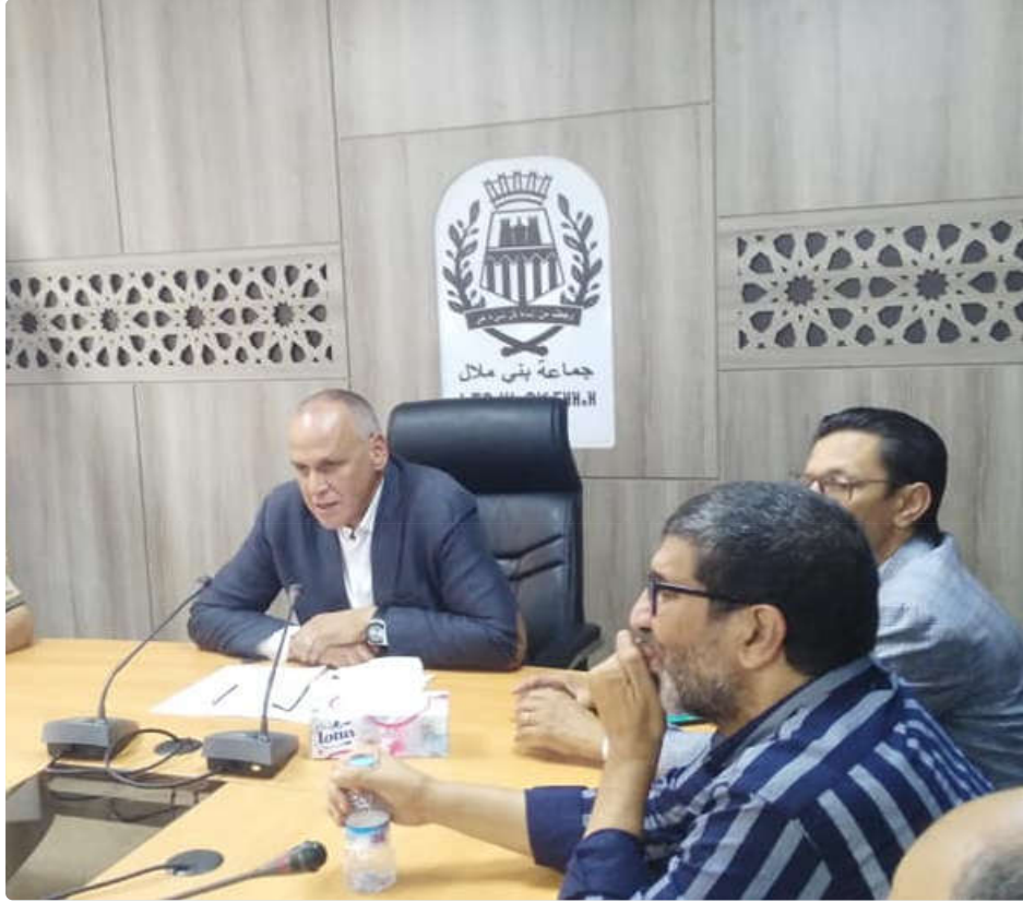
إجتماع المكتب المسير يوم 30 شتنبر 2019 من أجل المصادقة على الدليل

المرحلة الثالثة : مصادقة المكتب المسير على دليل تنظيم عمليات إستقبال المرتفقين بجماعة بني ملال