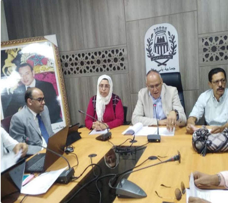
لقاء حول تقديم دليل الإستقبال