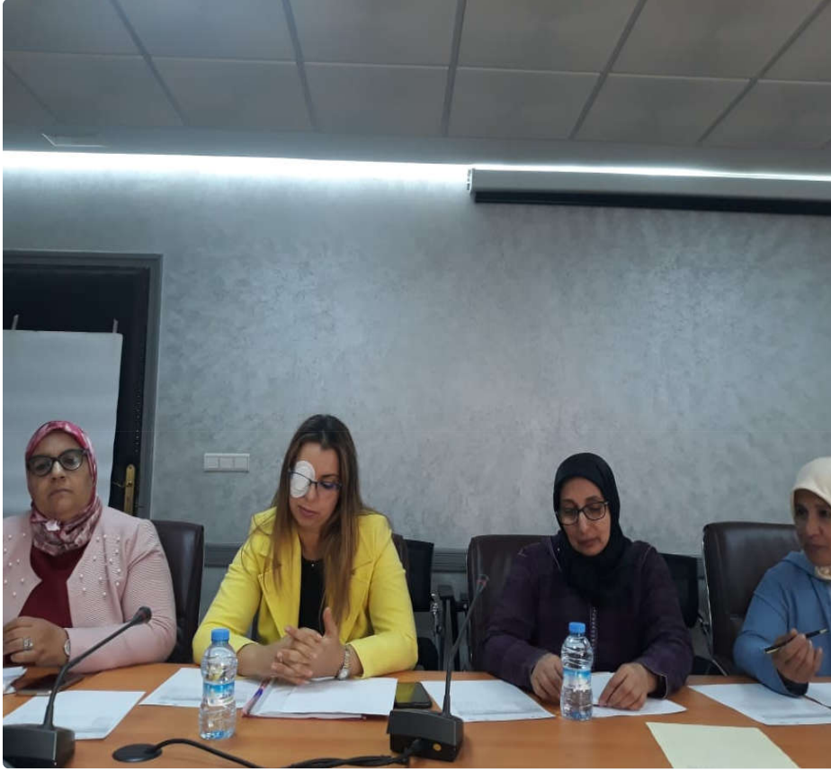
موظفات مكتب الاستقبال