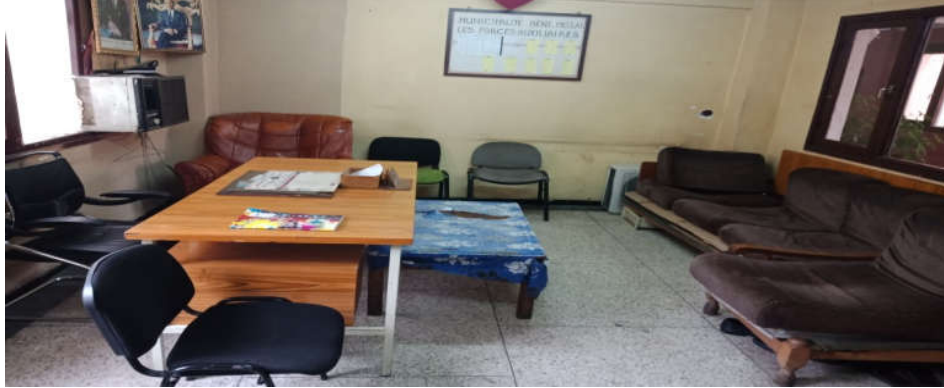
مقر مكتب الإستقبال المشغول من طرف القوات المساعدة سابقا

المرحلة الأولى : تشخيص وضعية الإستقبال بالجماعة مع تحديد الصعوبات و الإمكانيات