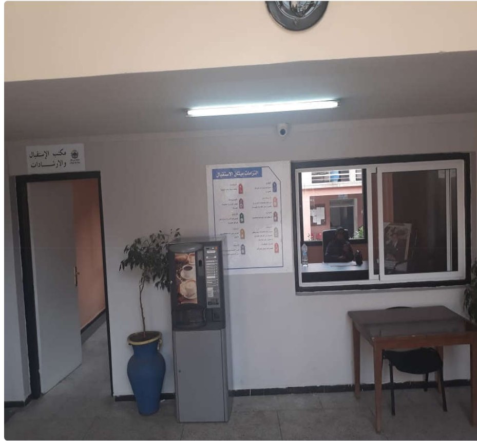
مقر مكتب الإستقبال بالجامعة حاليا

تهيئة مقر مكتب الإستقبال بالتجهيزات اللازمة و الضرورية